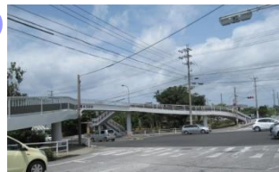
国道道路は交通量が多い。 陸橋あり。