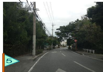
交通量が多い。抜け道あり