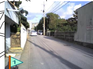
駐車が多い。飛び出し注意