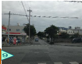
車が多い。 交差点に信号なし