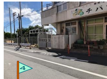
ガードレールが とぎれている