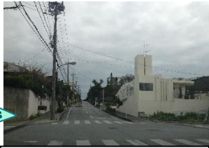
下り坂。 交差点に信号機なし。