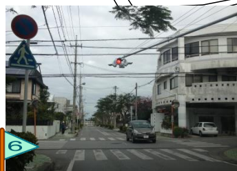
点滅信号付近、事故が多い。 停止しない車もある。危険。