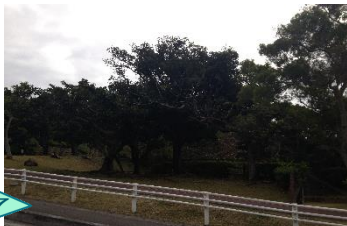
桑江公園内を横切らない。見え にくい場所で危険。池もあり。