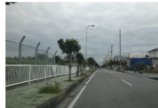
上勢頭地区は米軍基地が 広がっている。