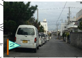
道幅が狭い。 路上駐車が多い。